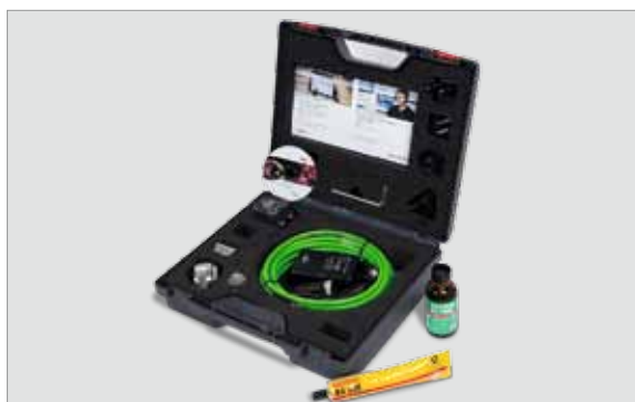
FAG SmartCheck Service-Kit