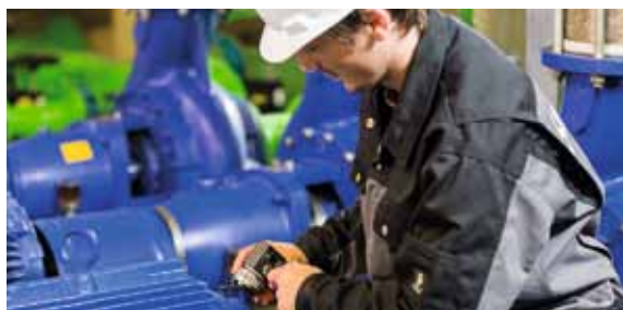
Применение измерительной системы, например, в электродвигателях, насосах, вентиляторах