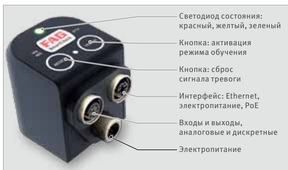
Интерфейс и органы управления FAG SmartCheck